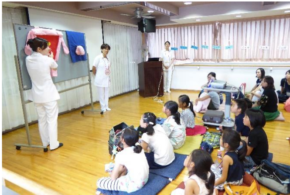
いのちの教室(院内)